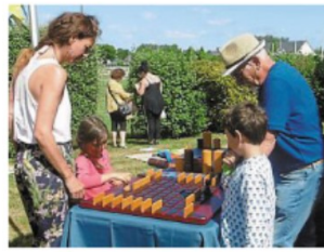
Un après-midi de distraction autour des différents jeux mis à la disposition des petits et des grands.

L'après-midi s'est achevée par un extrait du prochain spectacle de la