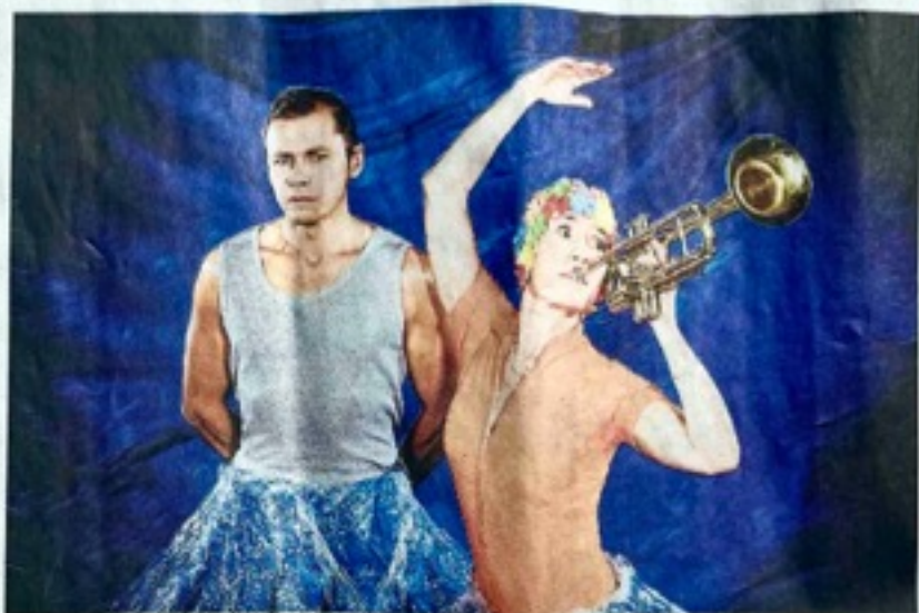
Le spectacle « Masques et tuba » a été créé par la compagnie Nid de coucou, en 2019.

L'auterice et compositrice, qui a formé Nid de coucou avec Jean-Marc Le Coq, il y a plus de vingt ans, a déjà réussi à trouver cet équilibre lors de ses précédentes créations sur l'hiver, le printemps et l'automne. Marions et châtagnes a ainsi reçu le prix Adami et a été retenu parmi les coups de cœur de l'Académie Charles-Cros.