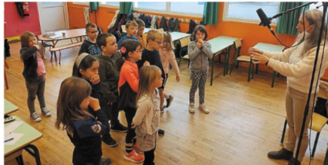
Des enfants studieux à l'écoute de l'intervenante.