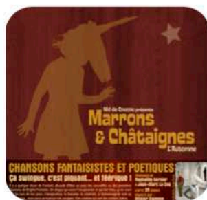
Marrons et Châtaignes