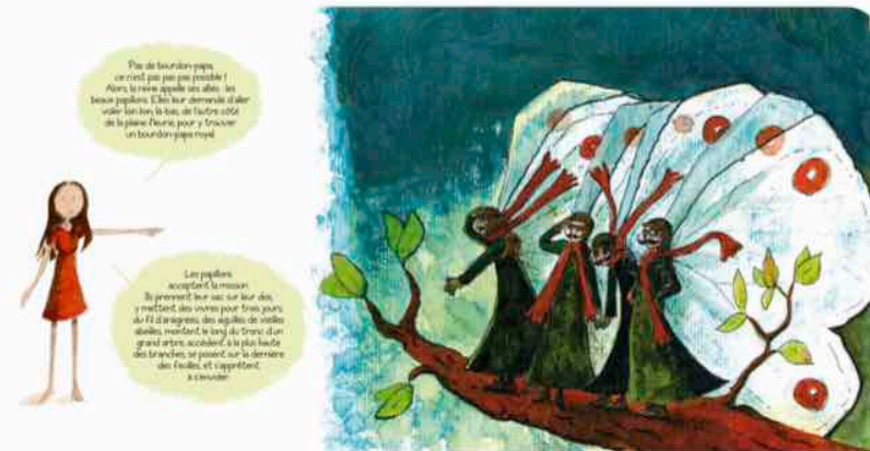
Illustration pour Abeilles et Bourdons

Applications Ipad : adaptation et traductions en anglais et espagnol